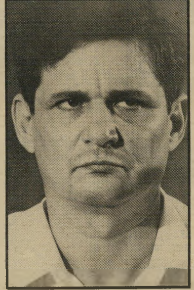
שרי-אוצר ארידור המפא"ניק של הליכוד

שקל, שהם 15 אחוז. חברת שופרסל הר-וויחה 54 מיליון שקל, שילמה שלושה מיליון שקל, שהם חמישה אחוזים וחצי. חברת הביטוח סהר הרוויחה 14.7 מיליון שקל, שילמה חמישה מיליון וחצי שקל, שהם כ-37 אחוז. מן תעשיות הרוויחה 4.3 מיליון שקל, שילמה 750 אלף שקל, שהם קצת יותר מ-17 אחוז. הכיצד? התשובה טמונה ב-מכבסת הי-מיסים המפורסמת. חברות גדולות, בני-קים, קבוצות ועצמאיים גדולים, גילו שאפשר לרכוש מיבנים, לשלם הצמדה וריבית ובסופו של דבר להתזיק ברכוש ששילמו עליו עשרה אחוזים מערכו. הבי-רות השקיעו במיליונים מועדפים, באגרות-חוב או בקרנות נאמנות; חילקו רווחים פטורים ממס לבעלי מניות, במהלך שנת המס. הקימו חברות-בת שאלוהן העבירו את עודף ההשקעה באגרות-חוב ללא ריבית, והחברה השניה קנתה ניירות-ערך פטורים ממס, בעוד שלעצמאי הקטן היו פקשים של מימון בתנאי אינפלציה. הוא שילם מס על רווחים נומינליים ולא על רווחים ריאליים, והגיע אף לשיעורי מס של 90 אחוז ויותר.