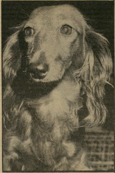
ניל דה'נוביל מוסו