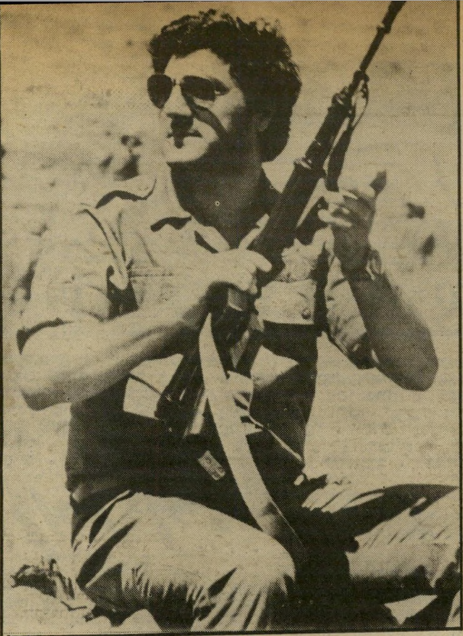
נשיא-מיועד אל-ג'מיל דמוקרטיה על כידונים

עליו כריתת חוזה-שלום עם ישראל, אין הוא רוצה לנתק את לבנון מהעולם הערבי, שבו מרוכזים כל האינטרסים הכלכליים שלה, אין הוא רוצה גם להיראות כקוויזלינג, היושב על הכידונים של כובש זר, יתכן מאוד שעם בחירתו כנשיא, ינסה בשיר להוכיח את עצמאותו כלפי ישראל - אולי אחרי ש-ישראל תעשה את העבודה השחורה ותגרש את הסורים, ואולי גם לפני כן.