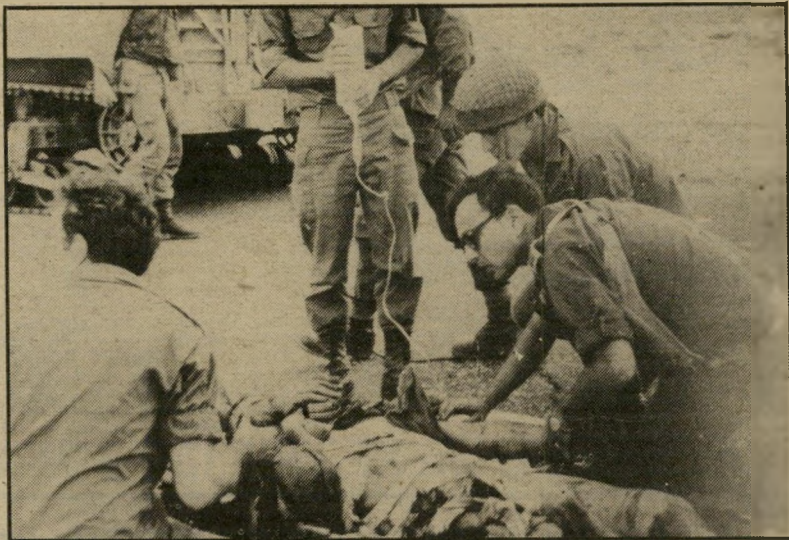
טיפול בפצוע בשדה-הקרב תעשיית התרופות

כמשך כל אותה העת, נהלה מערכת-התעמולה שהגיעה לעתים עד כדי גיחוך, בנסיון ליפות את פניו הקודרים של מחיר המלחמה. כמה שרים בממשלה שיתפזו פעולה בעניין זה עם שרי-הביטחון, וכמוהו גם פקידים באוצר. כך נר"ת היה לקרוא בעיתונים כי המירי חמא "תרמה ליעול המשק" סופר לאזרחי ישראל כי "הייצור כמעט שלא ירד", וגם ש"חוסדה האכט" לה הסמוייה. פורסמו גם מיספרי יום חפרי-שחר ע"י "מימדי הייצוא