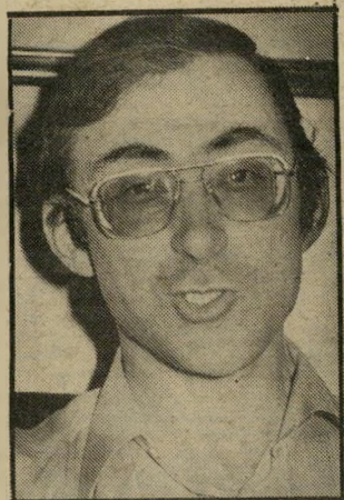
קורא כשר לפני ארי גבע

(אגב, הראיון בו הבעתי דיעה זו, התקיים שבועות לפני התפטרותו של אל"מ גבע.) נכונותי לשרת במילואים נובעת בדיוק מן ההבדל האמור. בלי לפרט, אומר שבשירות המילואים שלי איני אמור להפציץ או להפגין