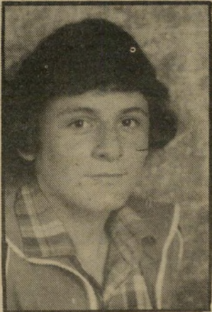
קורא פירמון להוריד את ההתנחלויות

ההתיישבות מעבר לקו הירוק היא סרטן האוכל בגופנו. היא באה על-חשבון פיתוח הגליל והנגב. מאות מיליוני שקלים מושקעים בהתנחלויות. מאות מיליוני שקלים