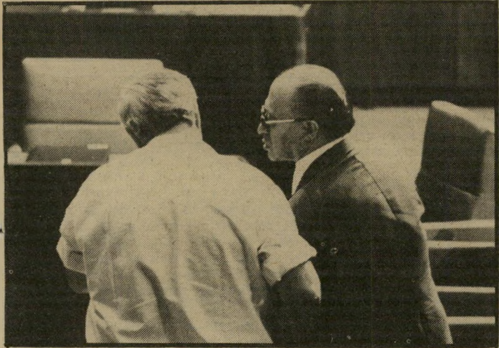
ראש-ממשלה בגין ושר-ביטחון שרון מי יהיה אישה-השנה?

אישה-השנה הוא ללא ספק ראש-הממשלה, מנחם בגין. הוא נהג כ-אומם מלכים אירופיים, ששיגרו את כלבי-הציד שלהם בעיקבות ה-שועלים והארנבות, וכאשר תפסו הכלבים בשוקי חיות הבר, לא הניח להם המלך לזלול את טרפם. כך גם בגין: שילח את שרון ואת צה"ל בלבנונים, בסורים ובפלס-