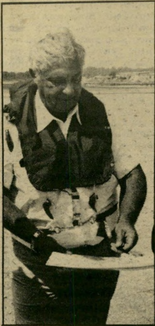
אישה השנה שרון? מילחמה

ברגע שבו המאבק נגד הממ' שלה מונגג על-ידי אישים בעלי תדמית מסוימת, כמו יוסי שריד, זאב שטרנהל או ישעיהו לייבוניץ, הרי עצם עובדה זו משרתת דווקא את בגין וממשלתו. צדק, לדעת,