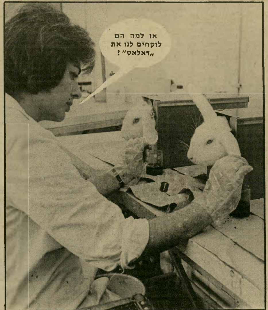
אז למה הם לוקחים לנו את "דאלאס"?

ישראל לתחילת חודש יולי. היה רוויך מגוייס. אייזנברג דחה את הפתיחה לשבת הש גייה של חודש אוגוסט. ואר בעה ימים לפני הפתיחה שוב נקרא רוויך לצפון. אייזנברג החליט לפתוח את התערוכה בלי הצייר, אך הבטיח לו ש בשנה הבאה הוא יתן לו את המקום לתערוכה על גופי לבנון.