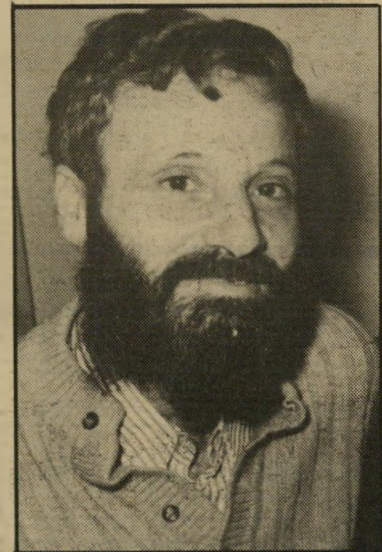
משורר טהר-לב הגודל אינו קובע

שישאר בינינו מלא כדמויים מן הילי דות, כמו בשיר אי החטמון: "כחושך /