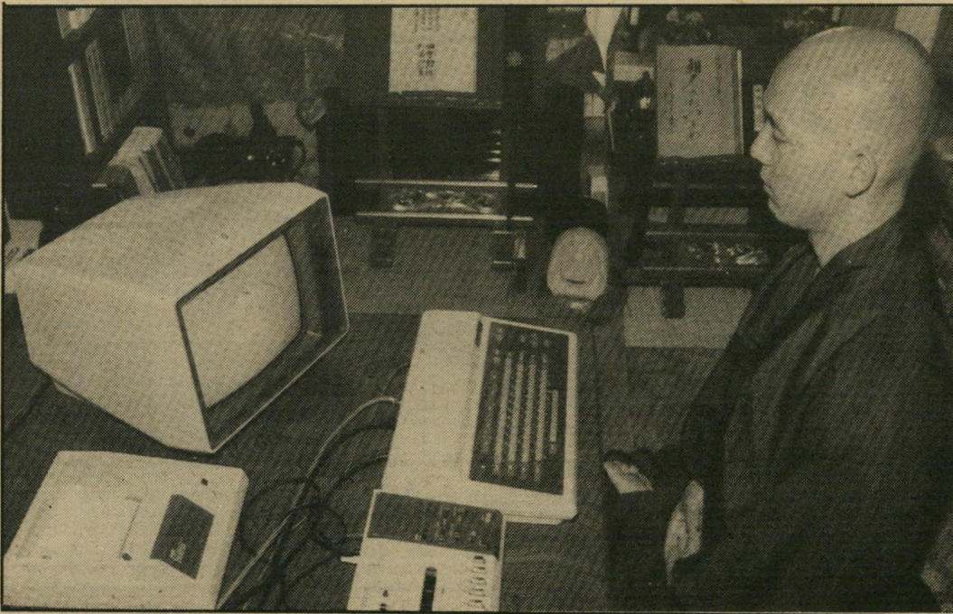
נויר יפאני ומחשב גיזענות בשירות הרכושנות

השבועון האמריקאי ניווויק, מקדיש השבוע 16 עמ' דים לתיאור האתגר הטכנולוגי היפאני לתעשייה האמריקאית והאירופית. היריעה הקצרה במדור זה אינה מאפשרת שיהזור הפרטים הרבים בסיקור הענק של השבועון, אבל יש עניין רב בתיאור גישת השבועון ליפאנים. המוטו של