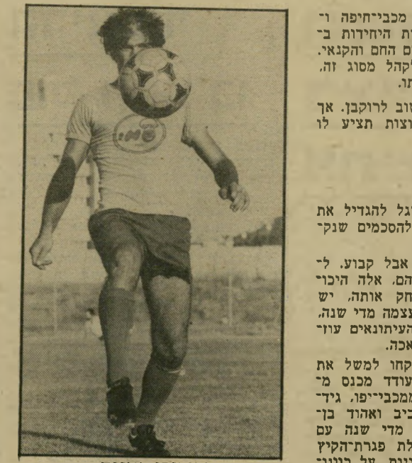
כדורגלן אוננה תרגיל קבוע

וביקוש פועלים בשוק הכדורגל בדיוק כמו בשוק הסחורות. יש ביקוש גדול לכדורגלנים טובים, ואין די היצע.