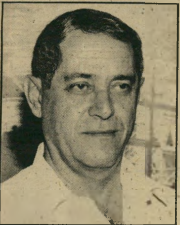
מנכ"ל שחר יסכים לשלם

אומנם, כך בדיוק אמר לי שלשום אחד המבצעים בבורסה. עכשיו עלה 5% לצאת מקרן. שלשעה שלצאת ממניה עלה 3%. שיתאמצו קצת יותר; על פי התשואות של הקרנות המתמחות במניות. אחוז אחד נוסף לא נחשב. ואפילו לא שני אחוזים. אז