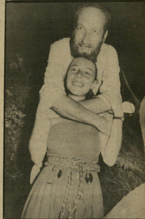
שלום עכשיו במאי הסרט אות קין, ואחותו חני ברבש פעיל ב"שלום עכשיו".

אנשי הסרט אות קין הצליחו גם ל-סיים את הסרטת הסרט, שהתעכבה עקב גיוסם של חלק מן השחקנים וגם לעסוק בפעילות פוליטית, בתנועת שלום עכ"שיו. שמתי לב לעובדה, שאנשי הקולנוע