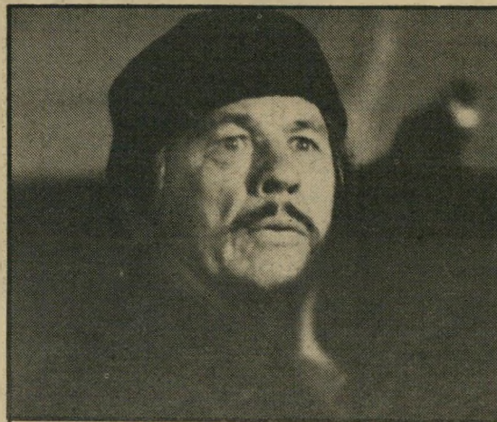
צ'ארלס ברונסון: אלימות דוחה

אין צורך לומר איך נגמר הסיפור, צריך אולי להרגיע את הדואגים, ולספר להם שמר ברונסון אינו מתכוון לתקן דרכיו והוא ממשיך לנדוד בלילות, ברחובות לוס-