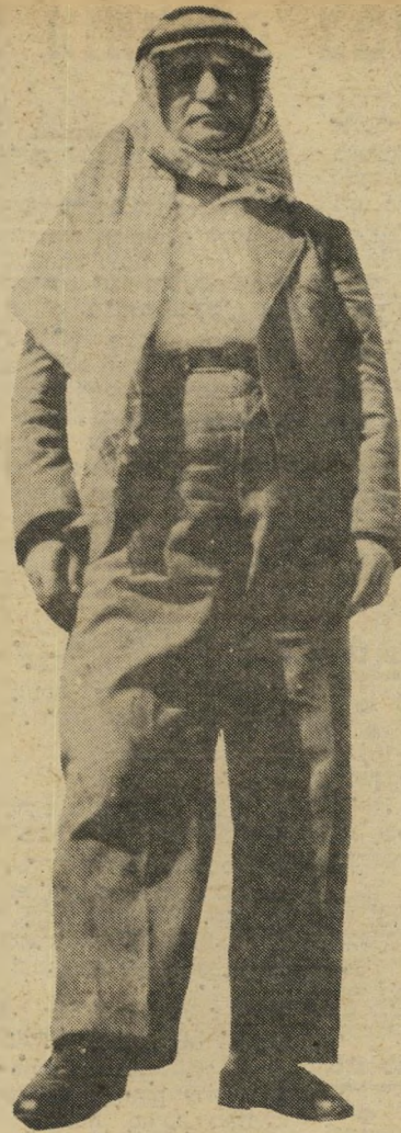
מנהיג בן-גוריון* ההיסטוריה ציוותה לחיות עם הערבים

* שמעון רשף — זרם העובדים בחינוך — מקורותיה ותולדותיה של תנועה חינוכית בשנים תרפ"א-תרצ"ט; הוצאת אונבר- סיטה תל-אביב והוצאת הקיבוץ המאוחד; 496 עמודים (כריכה קשה).