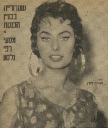
העולם הזה: 1034 תאריך: 7.8.1957

קש לפתע להצטרף לקבוצה של חיילים דתיים, שנסעו ליום עיון החייל-הדתי, ה- מאורגן על-ידי הרבנות הראשית.