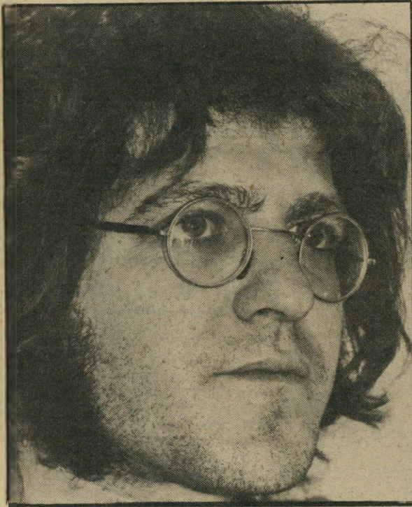
יקי יושע סיבה לגיטימית