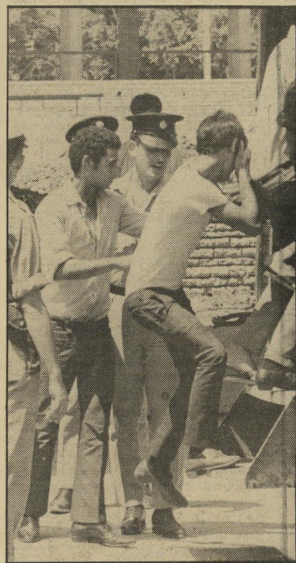
אנשים צעירים מראש-העין מורבלים למישפט. החבורה אינה נוצרת לצורך האונס הקבוצתי.