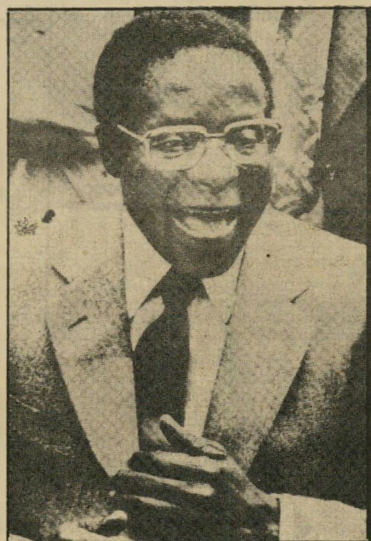
רוברט מוגאבה נסיון מקורי — אבל שרוי בסכנה

עם זאת סובל מוגאבה ממעשי חתייה בלתי-פוסקים של מתחרהו הגדול, ג'ושע אנקומו. בעיית אנקומו היא סבוכה, והטיפול בה מצריך הרבה טאקט ומיומנות פוליטית. מוגאבה הדיח אומנם את אנקומו ממשלתו, ושלח אותו לגלות שקטה בבולאוויו, אבל לא העז לנקוט נגדו באמצעים נוקשים יותר.