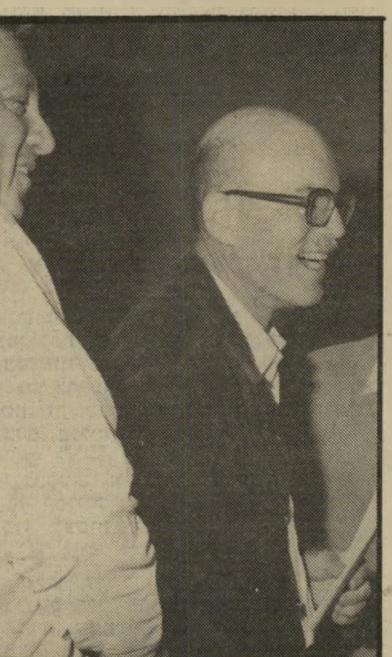
מואב עם אריאז שרון, ארגנתי הפגנות נגד כפייה דתית