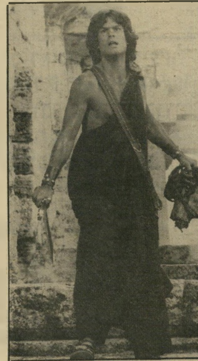
הארי המלון כפרסאוס לא בדיוק כמו התיולוגיה

לופו (גדול גולשיהמים של קליפורניה, ידידו האישי של הבימאי) ללמוד טכניקות-לחימה מסוכנות ולהסתכן מדי יום ביומו, בבצוען לפני המצלמה.