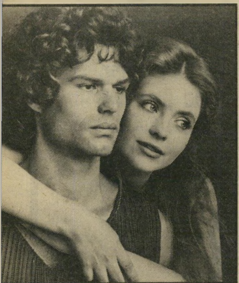
המלון עם ג'ודי באוקר אנדרומדה בהוליווד

אולי, אבל אם הסרט יצליח, לא יהיה זה בגלל המסר שלו, אלא משום שהוא חוזר לספק להקהל הרחב את אותן האטרקציות שבזמנו היו הקלפים החזקים של הקולנוע: יש בו פעילות למכביר, יש בו רומנטיקה, יש בו מיפלט מן המצוקות של המציאות אל תוך עולם פשוט יותר, מובן יותר, שבו הצופה מודהה עם הגיבור, שונא את הגבל,