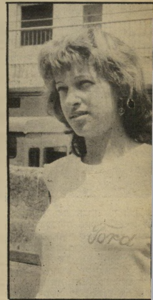
שותפה קהני העיקר גודל תחאים

ליעל היו לקוחות רבים מבני-רק. הגבר היתי נתון בלחצים ויננים גם בביתו, מסבירה המומי-ית. את אשתו יש לו רק ימים