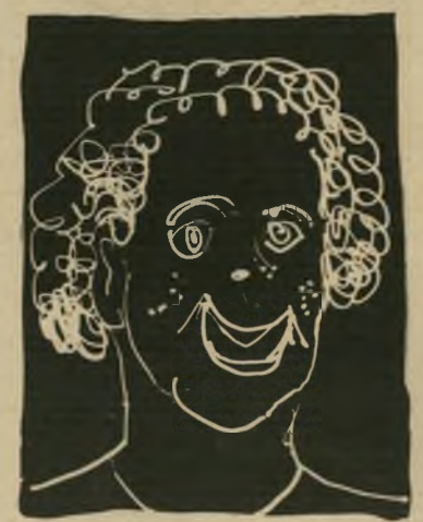
איש אש"ף לא לא ג'ינג'ים

הליברל הוא משהו בין 25 ל-30 מבחינת הגיל הביולוגי, אבל לגיל ה- ביולוגי אין שום שייכות להיסטוריה. הליברל כבר עבר כליכך הרבה בחייו הקצרים, שלא תוכלו לחדש לו כבר כלום. הוא עייף מאיזמים, הליברל, וביחוד הוא עייף מאנשים שעדיין יש להם איזמים. הם מזכירים לו את עצ- מו, כמו שהוא היה בגיל 18. אז גם לו היו איזמים, והוא האמין בהם, אבל עכשיו, כשהוא כבר מנוסה וגם ותיק, הוא יודע ששקר האיום. זה, הוא טוען, הוא האיום היחיד שהוא מאמין בו, ואף אחד לא יוכל לקחת את זה ממנו. קחו, למשל, את הפגנת שלום-עכשיו. זה לא מצחיק? באים אנשים נחמדים