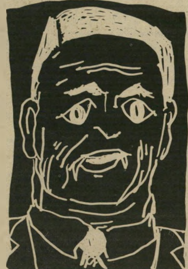
סנמור מקרתי מה שהשמאלנים עשו ממנו

אין כל האחרים. אחרי כל מה ש- עשו הנאצים ליהודים, יהודי טוב יכול להיות רק צנטרל, ליברל או רדיקל. כל האחרים נמחקים מדברי-הימים, וזה רשמי לגמרי.