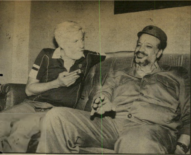
פגישת אבנרי-ערפאת מקום לתיקווה