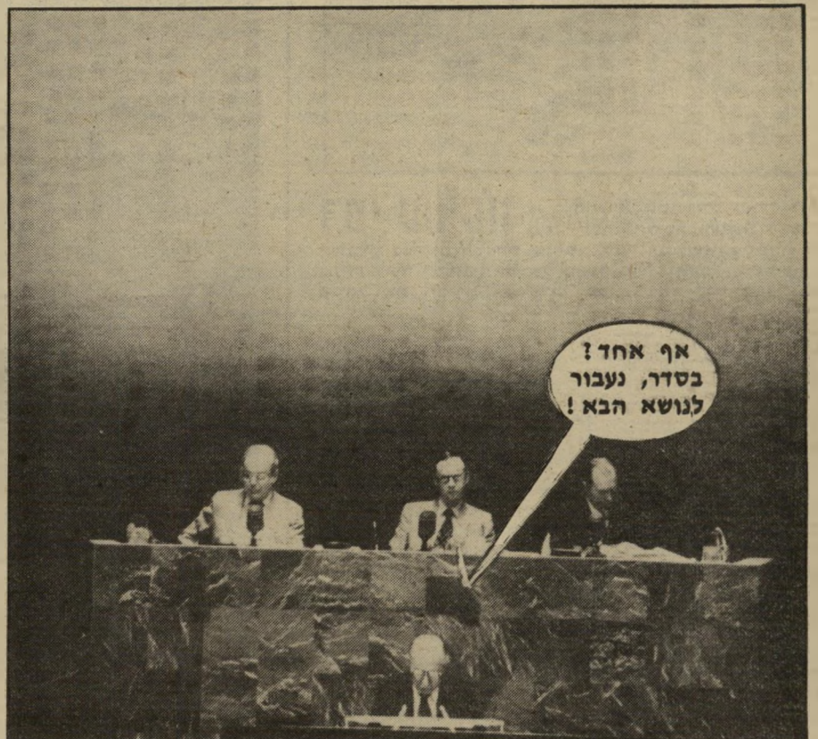
מנחם בגין בעצרת הכללית של האו"ם