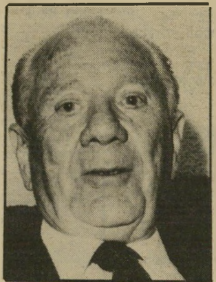
עובד בני-עמי הסברה בני-יוק