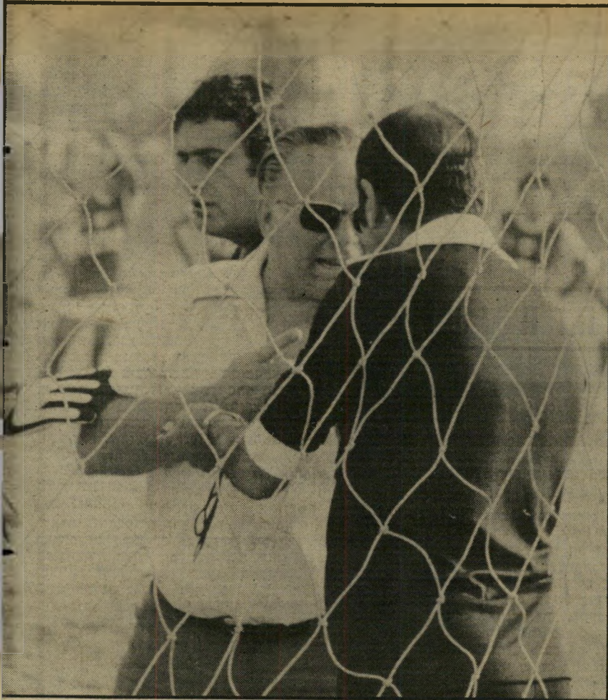
מאמן שווייצר בפעולה שינה תחזיותיו בספרד

בשבילי לא היה שום דבר חדש במיש-חקי ספרד השנה. אני חושב רק איך לישם את הדברים, שאינם חדשים בשבילי, בקבר-צות בארץ. כמו למשל: תנועת שחקנים ללא כדור על המיגרש, וחילופי מקומות של שחקנים תוך כדי מישחק. זה דורש תירגול ואימונים משותפים. אצל האיטלי-קים, הבלם, תוך כדי מישחק, תקף הרבה קדימה והפך בעצם לחלוץ, ומישהו אחר, באופן די מסודר, בא במקומו כדי לבלום. הכדורגל, שהוצג בספרד, הופך להיות מישחק של הרבה מחשבה ואילתורים,