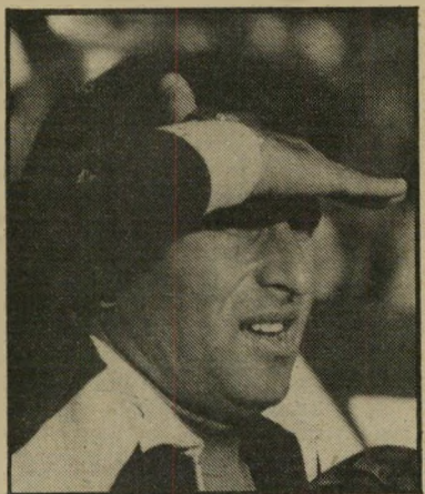
מאמן זלצר לא כדורגל אטרקטיבי

חדשים ממש. המישחקים בספרד היו המשך ישיר למישחקי ארגנטינה ב-1978. נראה, שהכדורגל בעולם הגיע לדרגה כזו, שמה שניתן לשיפור זה רק הכושר הגופני. מבר-חינת שיטות, לא ראינו שום דבר חדש, האליפות השנה הפתיעה הרבה אנשים, אולי לרעה. שחקני ברזיל הציגו כדורגל יפה ומהנה, אך ברגע שנתקלו ביריב שהוא מנוסה יותר, הם פיקשו. איטליה שיחקה בצורה מבוקרת, עם הרבה טאקטיקה, ובר-עיקר בלט ניהולו של המאמן אנוז ביארצוט. עם כל זה, שאיטליה לא שיכנעה במישחקי המוקדמות, המשיך המאמן לנהל את שח-קניו בצורה מעולה. יש לו, למאמן, חלק גדול בזכייה בגביע.