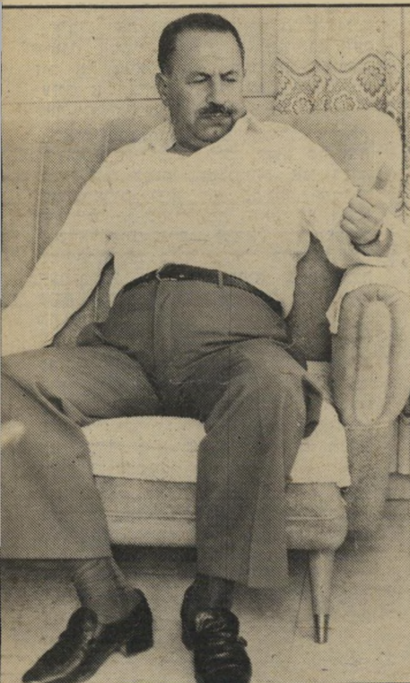
עורך-דין חזירי "פחד מפני השמדה!"