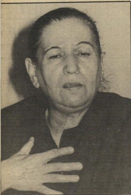
עסקנית חזירי "לנו אין סה להפסיד!"