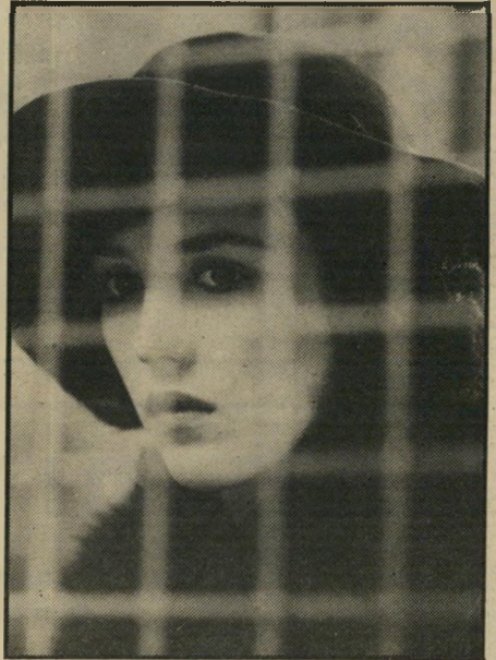
שחקנית איזבל אג'אני שחקנית וכוכבת

הצלחתה המסחררת כשחקנית התחילה עוד לפני שאפשר היה לנחש עד כמה היתה יפה. היא היתה בת 14 בלבד, כאשר עלתה לראשונה על קרשי בימת הקומדי פרנסו. שנה לאחר מכן היתה הסנסאציה של התיאטרון הזה כשהאפילה על כל שאר המומרים חים למוליקייר בבית הספר לנשים. בגיל