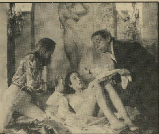
מונטאן ואג'אני: הכישרון הקומי

כל המרכיבים גם יחד, יוצרים סיפור בדים מצוץ מן האצבע, המכיל את כל הדפוסים השדופים של הקומדיה הרומנטית. בכל פעם שהעלילה נתקעת בנאף, שולף הבני-מאית-סרטיטיי ז'אן-פול ראפנו עוד שטן אחד מן הכובע, כך שהסיפור כולו מלא נסים ונפלאות שקשה להאמין להם.