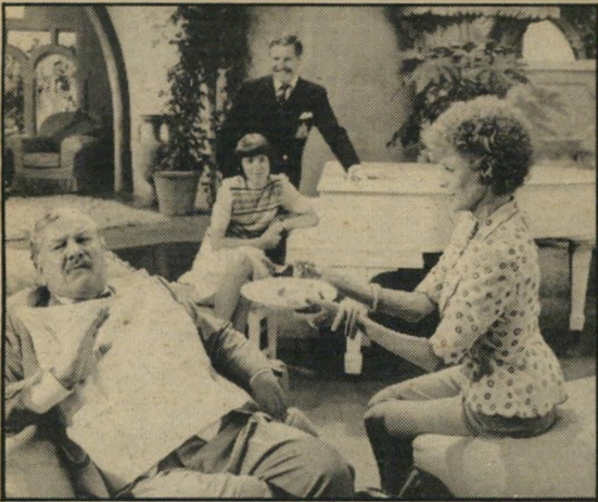
סמית ויוסטינוב: הברקות לרוב

גאי המילטון, שהיה אחראי בין היתר לכמה מסרטי