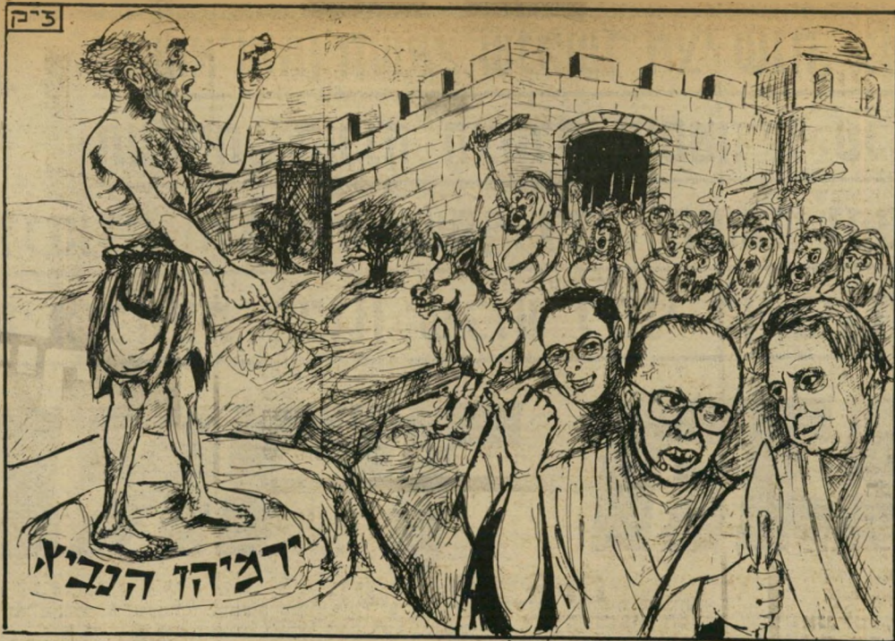
„האם הוא עבר את אחוזי-החסימה?“

השבוע, כאשר ראשוני העיתוי- נאים הגיעו למחנות אלה, הם מצאו שאינם קיימים עוד. הם הושמדו כליל. חלק מן המיבנים העלובים נהרסו בימי הקרבות, כאשר הלך- חמים הפלסטיניים לחמו שם עד מותם. שאר המיבנים נהרסו אחרי שוך הקרבות, כדי למנוע את שיבת הפליטים אליהם.