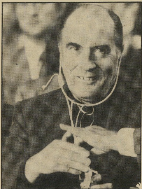
נשיא צרפת מיטראן