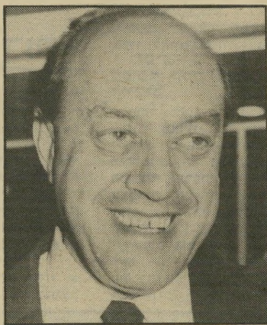
מירנארדר אייזנברג כדאי לקנות

המעניין הוא, שהראשונים ש עשויים להיפגע הן דווקא מפיקות נפט שאינן חברות, "אופ"ק" כמו בריטניה המפיקה נפט מהים ה צפוני, שמחיר הפקת כחית-נפט בו הוא כ-4 דולר: אם יירד המחיר, לא יהיה כדאי להפיק נפט מהים. עומת זאת, מחיר הפקת נפט של ה נפט הפוערי הוא 2 דולר לחבת כדבר, והם יכולים להרשות לעצמם, יחד עם רזרבות הדולרים ה ענקיות, לשבת בשקט.