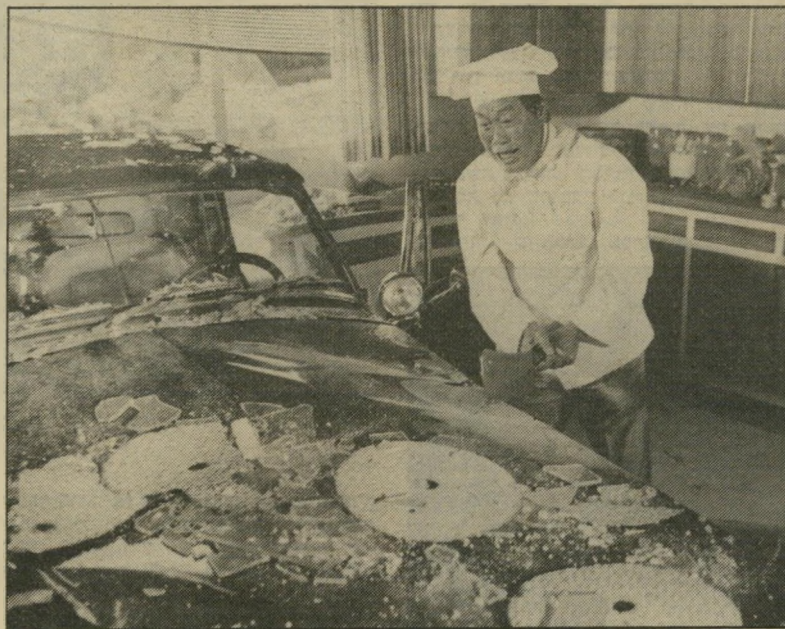
בנסמן פונג כתפקיד הטבח הסיני פגישה מיקרית של אורז ומכונית

וטעים, טוראית בנג'מין, חקירה לילית, האדומים. כלבי הקש. ירושלים: מילחמה ואבה, טוראית בנג'מין, פאדרה פאדרונה. חיפה: האדומים, חלף עם הרוח, שלושה אחים.