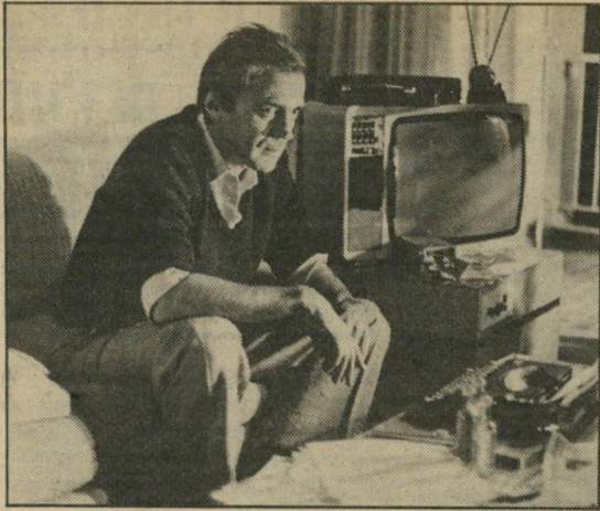
ברונו גאנץ: חוכמה בגרוש

כל מי שינסה לחדור קצת יותר לרוי המצב, לפי הסרט, יעמוד בפה פעור. ברור לו שהנוצרים הם כולם רוצחים חסרי נשמה, בין אם הם מסתתרים מאחרי מסיכות שחורות כשהם יורים בעוברים ושבים ברחוב, או שהם משתכשכים בבריכות-פאר, בחווילותיהם בהרים, כשהם מתכננים את חיסול אויביהם, או שהם מוציאים חיסול כזה לפועל באכזריות מעוררת סלידה. בהיותו בעל יומרה של אובייקטיביות, מראה שלנדורף גם את הצד השני, פלסטינים העורכים טבח בעיירה דאמור,