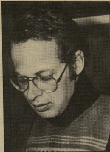
מראיין יערי לא הסכים

בתום השבוע הראשון למילחמה הועלתה הצעתם של כמה מעובדי הטלוויזיה