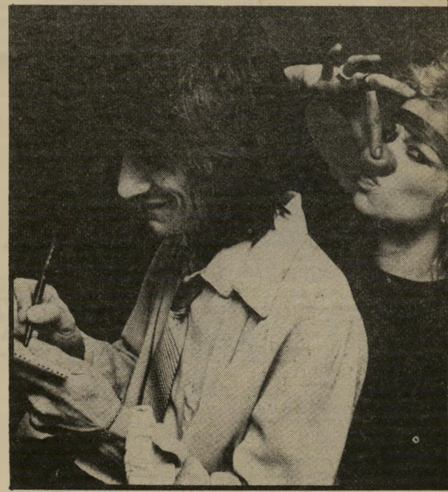
רון ווד: השתלמות בקירקס

שמו של ברנש אימתני זה הוא לורנצו טרו אבל הוא החליף, חקית ורישמית את שמו ל"מיסטר טי", הסיבה: "אנשים שיפנו אלי ייאלצו לומר מיסטר כשירצו לדבר אתי. אני מתייחס לאנשים בכבוד ואני רוצה שיתייחסו אלי בהתאם". מבט אחד במראהו של מיסטר טי יכול אמנם להסביר מדוע יתייחסו אליו בפחד מסויים, אבל את הכבוד קשה להבטיח מראש. אם כי תפקידו הקולנועי הראשון, כיריבו של סילבסטר סטאלונה ברוקי מס' 3, מבטיח לו תהילה מסויימת, הצניעות כבר רחוקה ממנו והלאה: "איך קיבלתי את התפקיד? פשוט האמנתי בעצמי. נתנו לי תסריט, למדתי אותו ברלילה והודעתי לסטאלונה: אל תחפש יותר. אני הוא האיש בשבילך." אין ספק שלמראהו של הבריון השתכנע סטאלונה מיד.