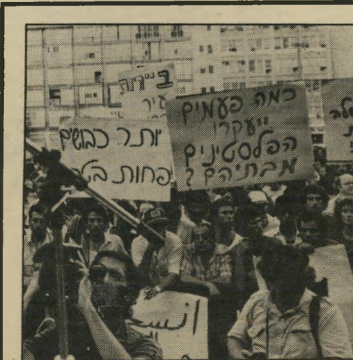
מחנה השלום מפגין נגד מילחמת-לבנון הפלסטינים לא ישכחו

את קשייו של ראש-ממשלת גרמניה, הלמוט שמידט. רוב המשקיפים מצביעים על בעיית הצבת הנשק הגרעיני על אדמת גרמניה, וההתנגדות העזה לכך מצד האגף השמאלי במפלגתו, כסכנה העיקרית להמשך קיום "שיל-טונג" בגרמניה. האגף השמאלי במפלגה הסוציאלי-דמוקרטית השלטת הצליח לזכות בתמיכה עממית חסרת-תקדים. הפער בין העמדות הולך וגדל, ויש המדברים אפילו על סכנת פילוג במפלגה.