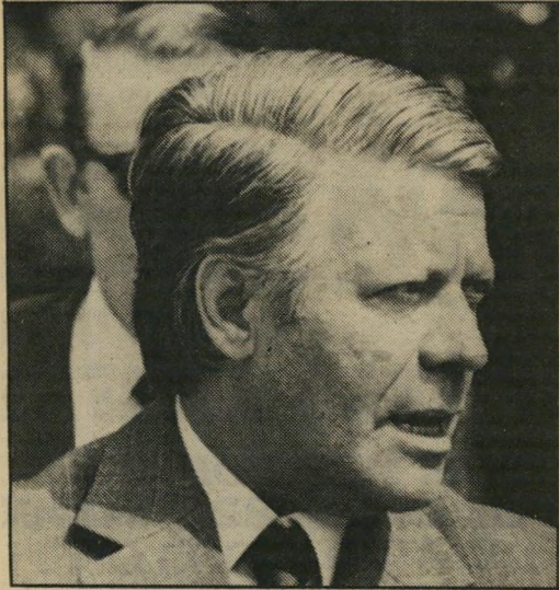
הלמוט שמידט 2200 פשיטות רגל

ייצב הדור החדש לפני בעיית האבטלה, שהילכה אימים על הדור הקודם, וסייעה לעליית הנאצים בגרמניה. צורת ההתמודדות הכלכלית, החברתית והפוליטית עם