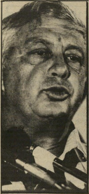
שרי ביטחון שרון "בבוא העת"

אני מצטט מתוך הכתבה: "אריק שרון מתנגד לפיתרונות חלקיים (של בעיית לבנון)... יש לפתור את