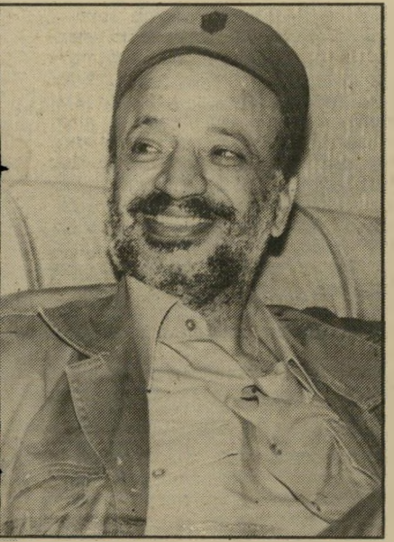
"אנחנו, הקורבנות, הצענו שלום!"

החיילים שגופותיהם בידיכם? ערפאת: כן, כן, יש לנו. אנחנו ניתן לך אותם, ברצון, יש לנו. אולי אתם רוצים לראות את הטייס?