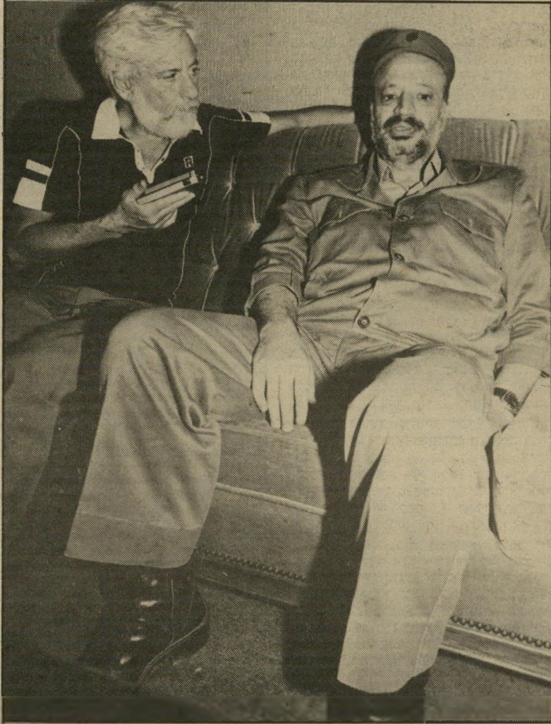
"הם יכלו להשמיד חצי מיליון מאיתנו..."

* אנשי אש"ף סופרים את ימי המילחמה החל מיום ההפצצות על ביירות, ב-4 ביוני.