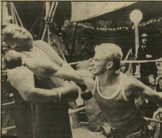
רובין ויליאמס: ללא עליצות

העירה סוויטהייבן צריכה להיות השתקפות של כרך אמריקאי, על תאוות הבצע שבו, שילטון הפחד, הצביעות ורדיפת השררה. פופאי צריך להיות האביר הבודד, מעין אקדוחן הבא לעיירה להביס את הנבלים לפי מיטב מסורת האגדה האמריקאית. אוליב היא מעין קריקטורה של הגיבורה הענוגה, המפונקת עד כדי כך שאינה יודעת לאן