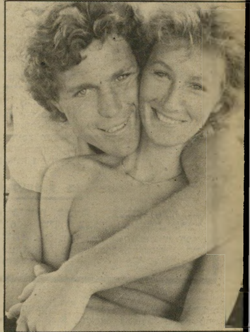
זוג שחקנים קדיי והייזברון שקספיר בקולג'

ג'ון בראבורן וריצ'ארד גודווין, שני המפיקים שהפכו את אגתה כריסטי למקור הכנסה לא מבוטל, למדו היטב את