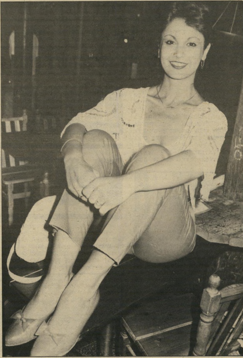
אתי צוברי אין נושא משותף

בעבר היה כבר קריבושה מעורב בכמה עט חתונה. אחרי שנסע עם הזמרת גלי עטר , שעמה היה לו רומן במשך שלוש שנים, לארצות-הברית, הכיר שם את הזמרת רותי נבון , שלמענה עזב את גלי. כשחזרו ארצה, התנהגו כבעל ואשה לכל דבר, לכן חשבו כל מיודעיהם שהם נישאו מעבר לים. אולם כעבור כמה חודשים נפרדו. ללא צורך בגט, ורק אז הסתבר כי כלל לא היו נשואים.