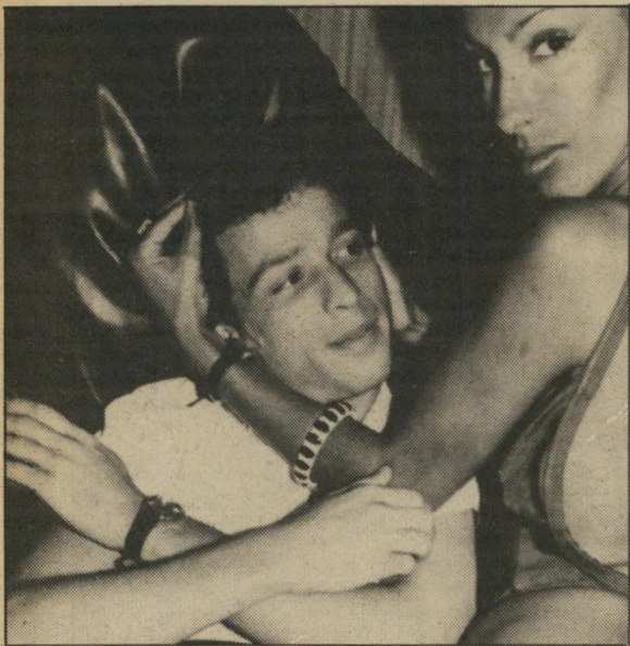
יפתח קצור וידידה רן מהסרטים

כוכב יוצאים קבוע ושיפשוף נעים היה בעבר חברה של השחקנית איבון מיכאלי , שככבה לצידו. אחר-כך היו ליחי שושנים שיש משהו בינו ובין השחקנית דליה שימקין , כוכבת הסרט נועה בת 17, שלצידה עדיין לא שיחק. אך נראה שהשחקן המוכשר החליט בכל זאת שלא לשבור את המסורת, ובחר לבסוף בגלית, חברתו לעבודה.