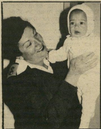
מנהלת אפשטיין* עד גיל שנתיים

אם אורית ארביב תרצה בכך, איני חושבת שתיווצר בעיה בקשר להחזקת