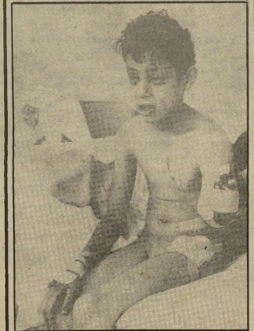
קורבן לבנוני בן 10 כל מטוסינו חזרו בשלום לבטיסם

ילד לבנוני זה הוא אחד מאלפים רבים של ילדים,