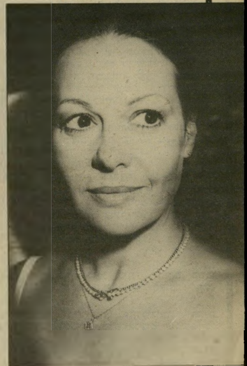
גיהה ארמגור כועסת נורא

הופיעו בתנאים לא-תנאים ונתנו חמש הור פעות ביום.