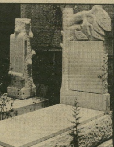
מוסעת המצבות של התעשיינים האחים חליבה עבודה רבה