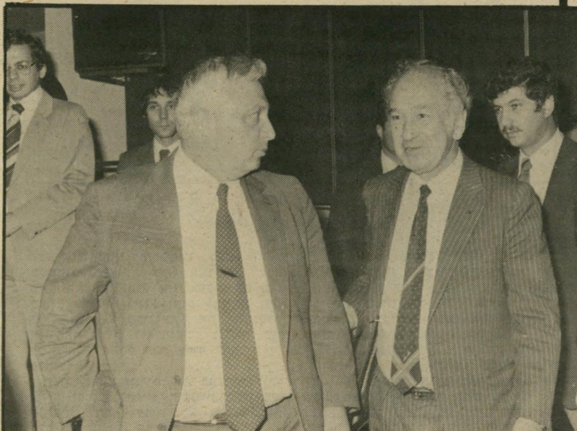
מדונאי שיף אשר הביטחון שרון הרוב תומך

כדי להקנות אמינות לרשימת השמות, מתפרסם ליד כל שם מיקצועו של החתום.