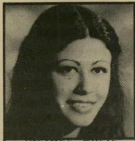
קוראת רבינוביץ יד ראשונה

הקוראת כותבת שיר הסי- פד על חבר שחזר בתשובה.