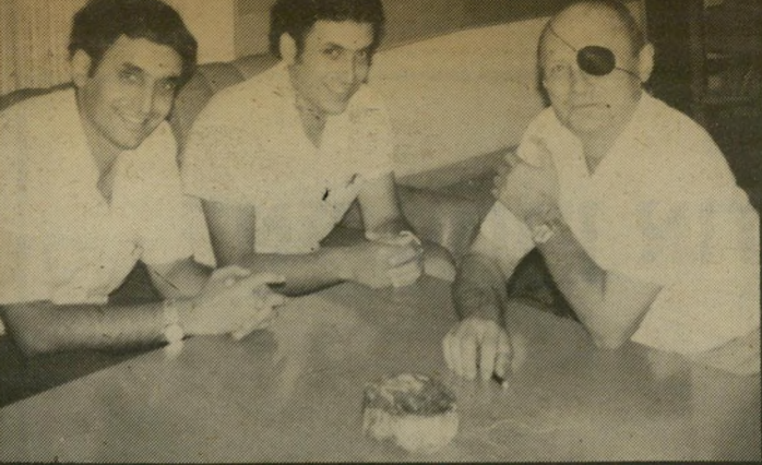
האחים חקק עם משה דיין מעשה שהקאיב לרבים

דיין). כשפגשנו אותו ביולי '77 שאל אותנו מייד: "מדוע הקמתם ועד ציבורי למעני?" "השבנו גלוי- יות: הרגשנו כי אתה נרדף ולא יכולנו לעמוד מנגד כשקמים לעי- שות מסע-צלב נגדך. אנו מאמינים שיש לך עוד מה לתרום למדינת ישראל".