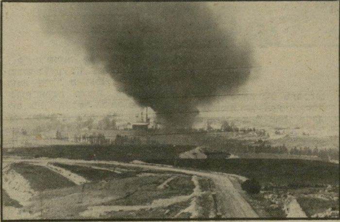
פיטריית עשן במילחמה תמיד אנתו תמונות

כשראיתי את התמונות שהגיעו מן החזית על מילחמת הלבנון, את סיטריות העשן, את הבתים ההרר"סיים, את הטנקים השרופים, ה"שבויים וכל היתר, אמרתי לעצמי