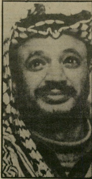
מנהיג ערפאת שערות על הפנים

בכל יום כשאני נזכר שמנחם בגין הוא ראש-הממשלה של מ"מ