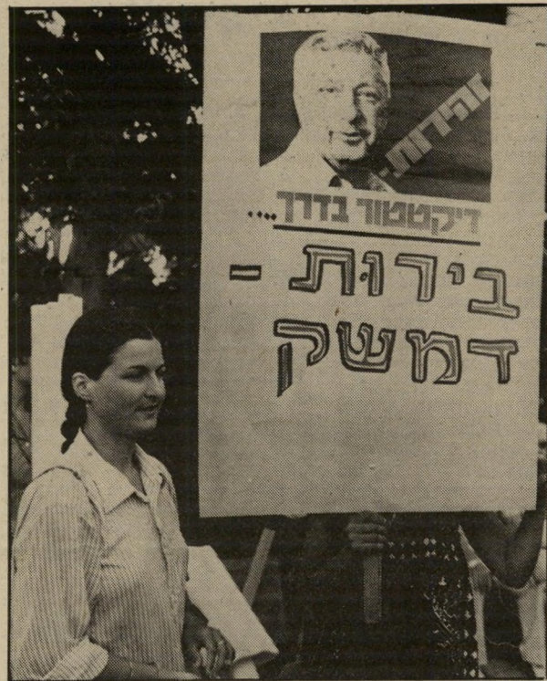
אריאל שרון הפך להיות סמל המילחמה. מעל לבמה קראו הנואמים להתפטרותו בממשלה כבתוך שלו, והונה את הכנסת.

הניסיונות להפריע למפגינים היו שוליים. השוטרים לא התקשו לסלק את המפגינים. אך לא העלו על דעתם כי צריך לעצור אותם. למסערה היה עניין