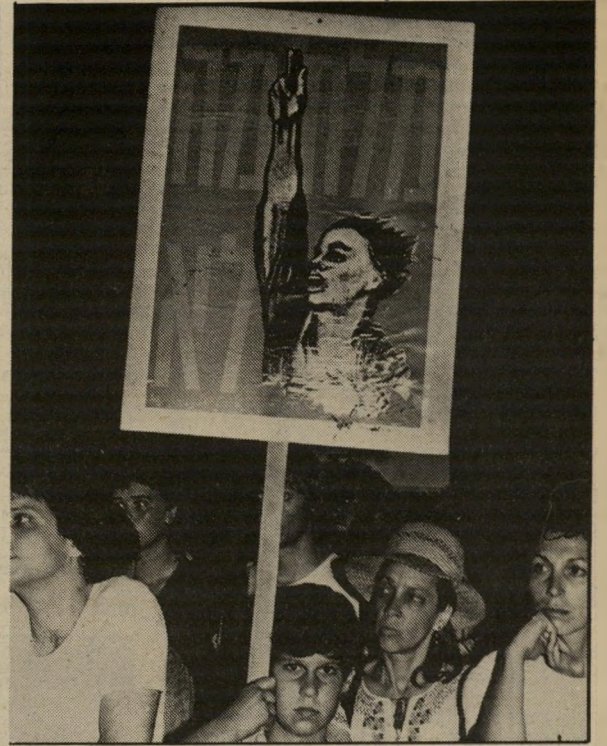
הכרזות שנישאו על-ידי המפגינים היו בוטות יותר מאשר בכל הפגנה המונית מסוג זה בעבר. כרזה זאת מבטאת את ההתנגדות למילחמה, שמתנהלת מזה שבועות.

חשוב יותר לעסוק בו: היא ניסתה להמעט ככל האפשר במיספר המפגינים בהודעותיה לכלי התקשורת. אך קשה היה לרמות את מצלמות הטלוויזיה ואת מצלמות ה"עיתונות". כיכר מלכי ישראל היתה מלאה וגדושה מפגינים.