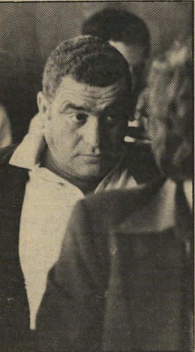
חשוד חקאק פגישה בחנות

ספורט האופניים נחשב לספורט הקשה ביותר, קשה יותר גם מריצות המרתון. בעוד שאת המרתון אפשר לסיים בשתי חיים-שלוש, נמשכים מירוצי האופניים בין שלוש לחמש שעות, כולן רצופות מאמץ גופני מייבני. בסופו של המירוצן הגוף כואב במשך כמה ימים, מחומצת-החלב הרבה, המצטברת בשרירים.