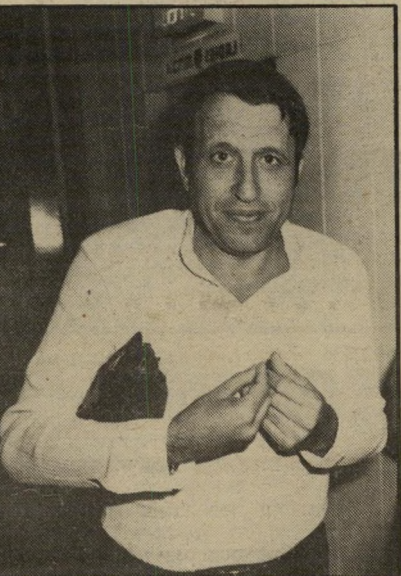
מנהל-בידור חפון לתת את הדין

● בדיחה המהלכת בפרוודורי ה- טלוויזיה, קול-ישראל וגלי צה"ל, טוענת