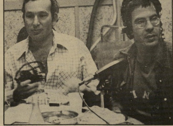
מנחים שלי וירונדון לתי דומים ילדי אשף?

כבר בשידור הראשון שבהנחייתו שאל לונדון את הפרופסור ירמיהו יובל את השאלה: "האם דומים ילדים בשירות אשף, הירורים בחיילינו, לנוער ההיסלראי או לילדי גיטורא-רשה?" שאלה המעוררת למחשבה, שדומות לה לא נשמעו על המסך הקטן במהלך השנתיים האחרונות.